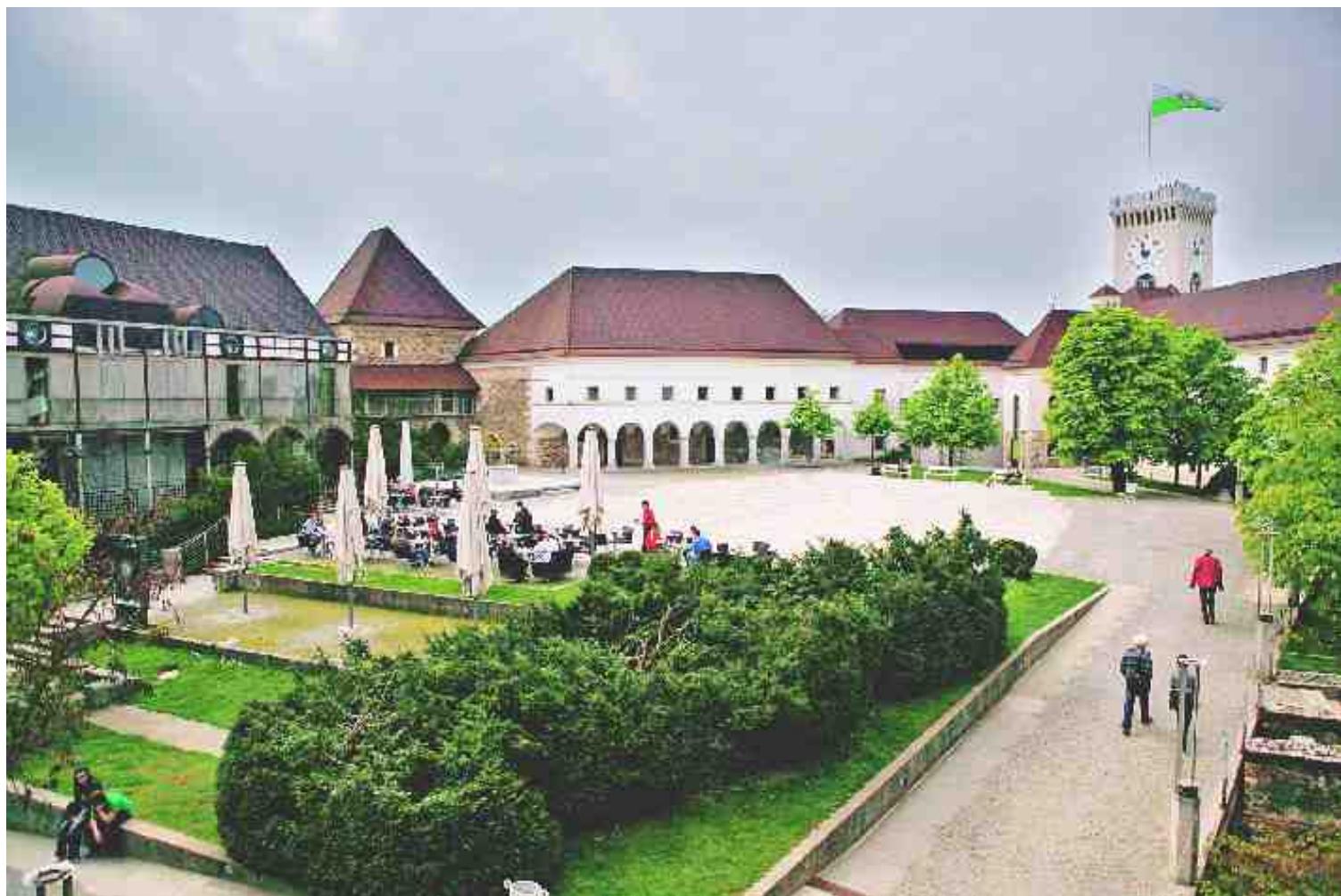
KMALU NOVA PONUDBA NA LJUBLJANSKEM GRADU